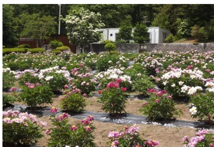
養命酒のシャクナゲ園