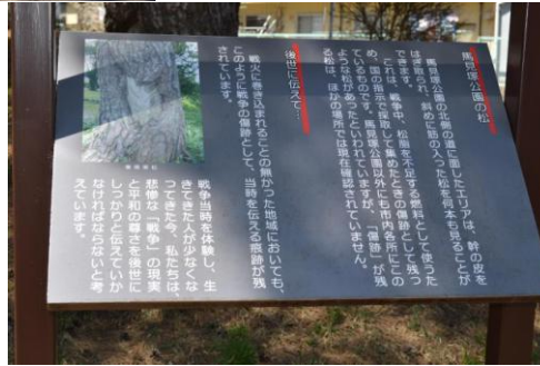
↑ 戦時中燃料不足を補うため、 松脂を採取した傷跡が残る松(傷痕軍松)