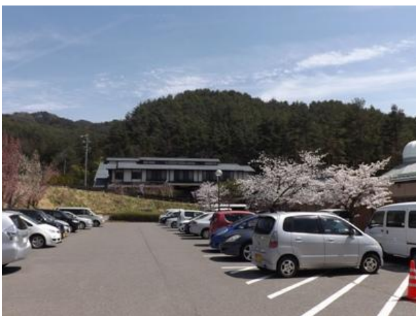
シルクミュージアムから見た ふるさとの家の門