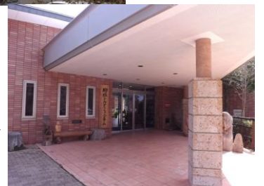
シルクミュージアム入口 ⇨